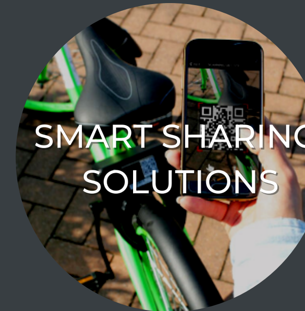
SMART SHARING SOLUTIONS