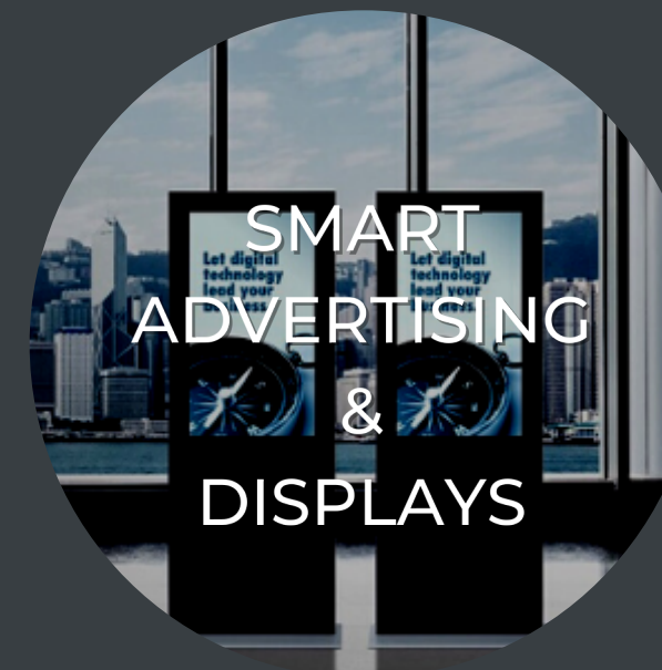
SMART ADVERTISING & DISPLAYS