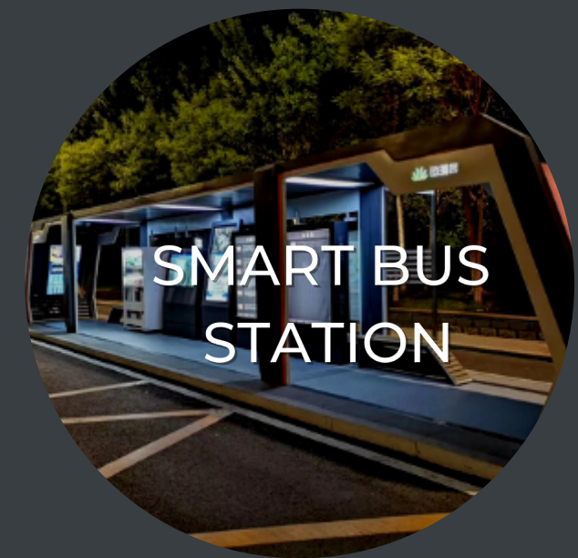
SMART BUS STATION