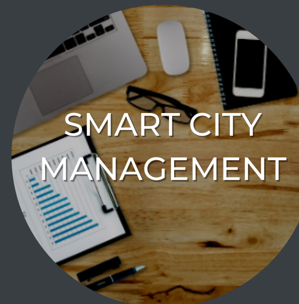
SMART CITY MANAGEMENT