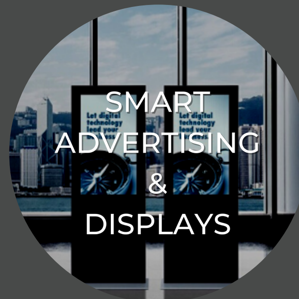
SMART ADVERTISING & DISPLAYS