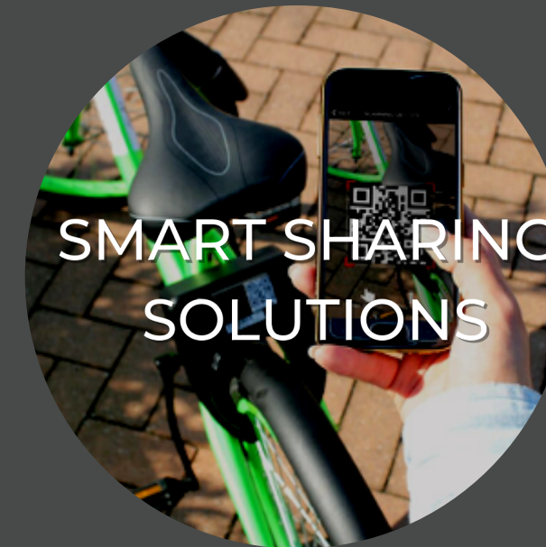
SMART SHARING SOLUTIONS