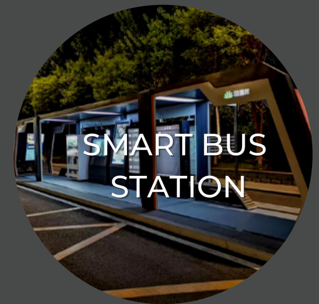
SMART BUS STATION